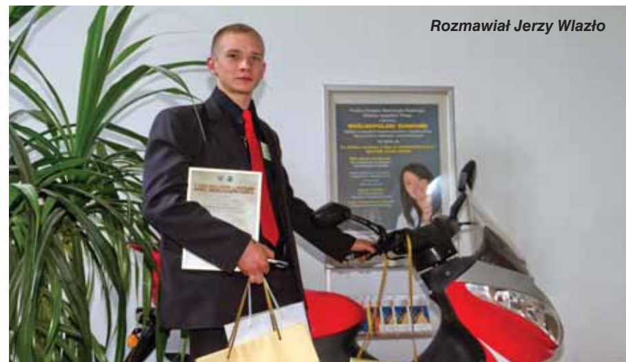
Rozmawiał Jerzy Wlazło

– Jesteś młodym człowiekiem, chcesz powiedzieć, że kiedy na przykład wyrabiasz ciasto, to myślisz o bezpieczeństwie pracy a nie o meczu albo muzyce?