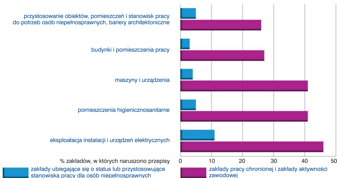
Wykres 65. Zatrudnianie niepełnosprawnych – naruszenia przepisów