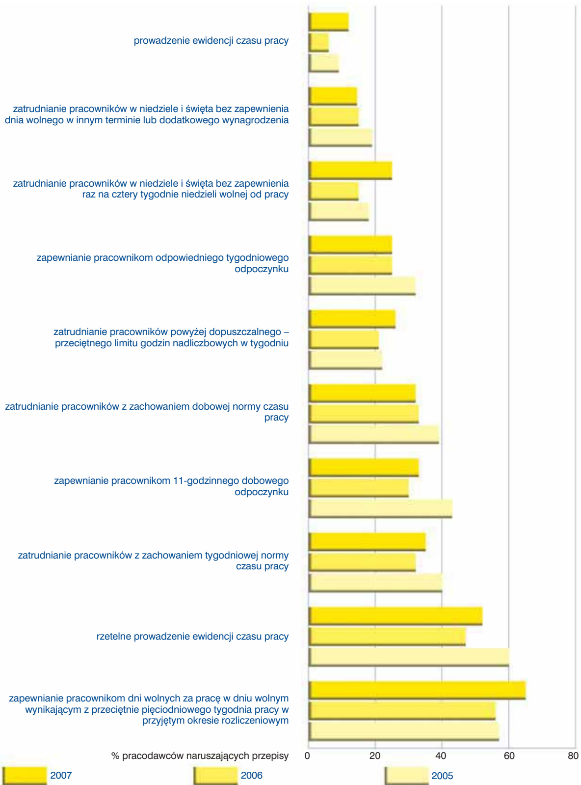
Wykres 23. Czas pracy – naruszenia przepisów